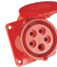
Prise norme IEC 60309 5P 16A IP 54

Câble de mise à la terre des masses métalliques de la machine, raccordé au point équipotentiel supplémentaire du bâtiment.